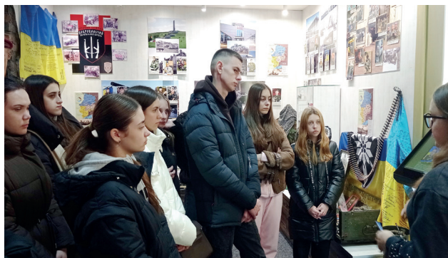
Студенти факультету географії, історії та туризму на практичних заняттях в музеї

3) викладачі та студенти факультету брали активну участь у міжнародних конференціях з університетами-партнерами в країнах Європи.