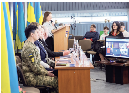
XXX Міжнародні громадські учнівські читання «Я голосую за мир» в МЕГУ

У ПВНЗ «Міжнародний економіко-гуманітарний університет імені академіка Степана Дем'янчука» відбулися XXX Міжнародні учнівські громадські читання «Я голосую за мир» – масштабний освітньо-просвітницький захід, який уже багато років об'єднує учнів, педагогів, науковців і громадськість навколо ідеї утвердження миру, гуманізму та громадянської відповідальності.