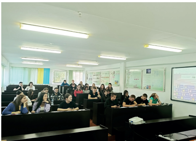
Студенти складають тести в навчальному середовищі Kahoot

Випускники економічного факультету займають керівні посади на таких підприємствах: СВСК «Селянський ліс», ТОВ-АФ «Інформ-Дельта-Аудит», АТ «Укрсиббанк», Agricom Group, ПрАТ «УСК «Князя Вієнна Іншуранс Груп», ПМП НВФ «Продокологія» та багатьох інших.