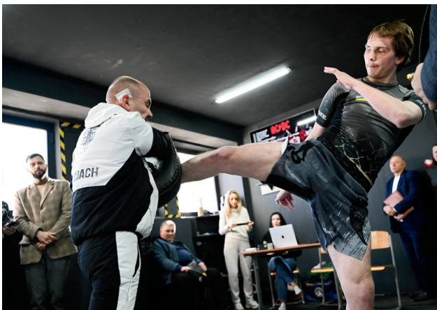
Відкрите заняття спортивного клубу змішаних единоборств ММА-СКІФ

Значна увага приділяється розвитку активності студентів, що реалізується через їхню суспільно корисну діяльність у навчально-виховних, навчально-реабілітаційних та спортивних організаціях і установах та виступає необхідною умовою забезпечення її якості. Професійні вміння і навички успішно формуються в процесі залучення студентів до волонтерської діяльності в закладах освіти, охорони здоров'я, Центрі інвалідного спорту, навчально-реабілітаційних установах міста та області, а також залучення їх до проведення спортивних змагань та реабілітаційних заходів серед дітей з особливими потребами.