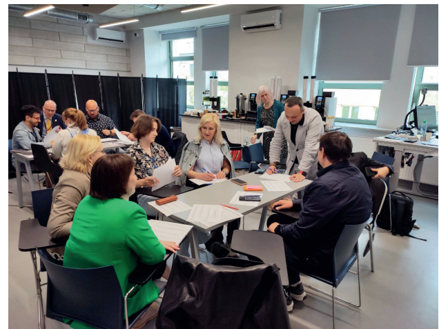
Візит делегації МЕГУ до Варшави в рамках проекту Pump Priming Collaboration

У березні 2026 делегація МЕГУ разом з Університетом Бат Спа взяли участь у міжнародній конференції у м. Ліверпуль, де провели низку зустрічей із міжнародними партнерами, зокрема в межах програми Science for Ukraine, а також обговорили перспективи співпраці з Coventry University та University of Oxford.