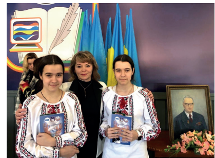
Учасники XXX Міжнародних громадських учнівських читань «Я голосую за мир»

війни в Україні значення цього заходу набуває особливої суспільної ваги, адже він є важливим інструментом формування національної свідомості, культури миру та духовної стійкості молодого покоління.