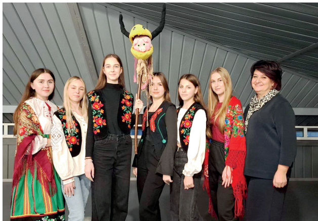
Студенти історико-філологічного факультету готуються до щорічного конкурсу колядок і щедрівок в МЕГУ

Майбутні філологи – активні учасники проєкту «Бібліотечна КнигоСтудія «Читацьке Бюро» в рамках Всеукраїнської ініціативи «Додай читання» на базі КЗ «Рівненська обласна бібліотека для дітей», флешмобу до Дня рідної мови, інтерактивних ігор «Антисуржик», «Грамотій»; літературно-мистецьких імпрез: «Шевченківські читання», «Костенківські читання», «Конрадівські читання» тощо, традиційного щорічного конкурсу «Spelling Bee», постерів на тему «The defenders of Ukraine – the Heroes of our time (Захисники України – Герої нашого часу)».