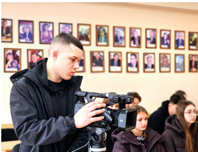
Студенти факультету журналістики під час практико-орієнтованого навчання

За роки існування факультету його закінчили понад 400 спеціалістів, які працюють за фахом в Україні та за її межами. Серед них ті, хто отримали різноманітні нагороди, стали заслуженими журналістами України, заслуженими працівниками культури, редакторами, директорами телерадіокомпаній, видавництва.