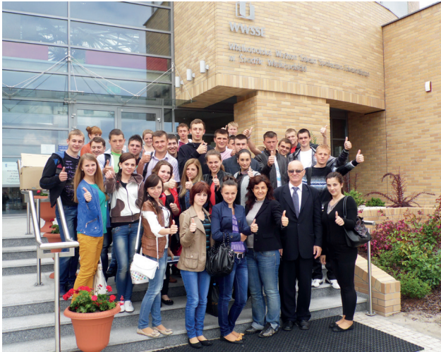
Студенти факультету європейської освіти у Великопольській академії суспільно-економічній в Сьроді Великопольській – Академії Прикладних наук на екзаменаційній сесії

Факультет європейської освіти Міжнародного економіко-гуманітарного університету імені академіка Степана Дем'янчука пропонує студентам, котрі планують отримати справжній європейський диплом, навчання на бакалаврських та магістерських програмах за такими спеціальностями: