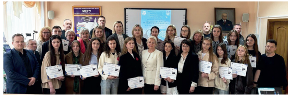
Учасники конкурсу наукових робіт «Проблеми війни та миру: український вимір» до 100-річчя від дня народження академіка Степана Дем'янчука

ження академіка Степана Дем'янчука, яка об'єднала навколо актуальної проблематики миру, освіти та науки науково-педагогічних працівників, молодих учених, здобувачів освіти.