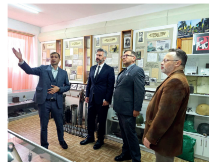
Делегація з Республіки Польща на ознайомчій екскурсії в Музей Миру МЕГУ

Представлений в експозиції й тематичний вузол з педагогіки миру. Щорічно в березні Музей Миру приймає учнів зі шкіл Рівненщини та регіону – учасників учнівських громадських читань «Я голосую за