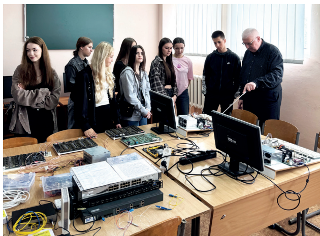
Лабораторне заняття студентів факультету кібернетики в комп'ютерному класі МEGУ

«Інженерія програмного забезпечення Інтернету речей» – освітня програма, яка орієнтована на IoT, що стрімко розвивається: розумні будинки, промислова автоматизація, транспорт, охорона здоров'я – усе більше пристроїв об'єднуються в мережі, потребуючи надійного програмного забезпечення. Ринок праці має високий попит на розробників, які вміють проєктувати, створювати й підтримувати програмне забезпечення для пристроїв IoT.