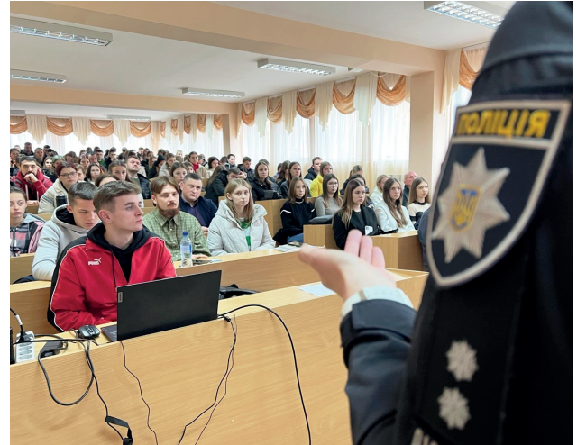
Відкрита лекція на тему: «Кібербезпека в сучасному світі: виклики та практичні аспекти боротьби з кіберзлочинністю» за участі представників кіберполіції

Для забезпечення якісної практичної підготовки на факультеті функціонують спеціалізовані аудиторії та сучасна матеріально-технічна база: навчально-криміналістична лабораторія, юридична клініка, навчальна судова зала, комп'ютерні класи, бібліотека.