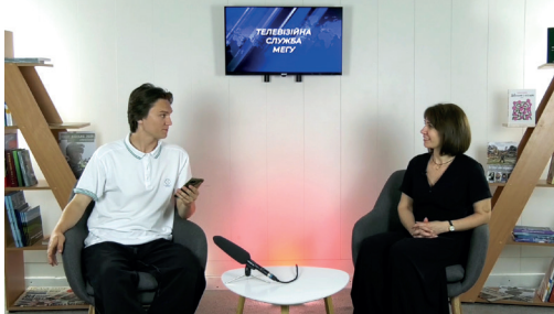
Процес зйомки одного із випусків ТСМ МЕГУ з деканом факультету журналістики

пускників змогли отримати перше робоче місце в місцевих, регіональних та всеукраїнських медіа.