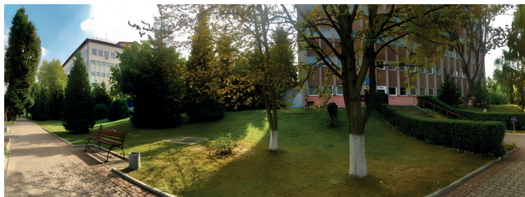
Навчальні корпуси ПВНЗ «Міжнародний економіко-гуманітарний університет імені академіка Степана Дем'янчука»

– максимальний рівень клієнтоорієнтованості: університет отримав 10 балів, що свідчить про найсучасніші сервіси для здобувачів освіти та швидку комунікацію;