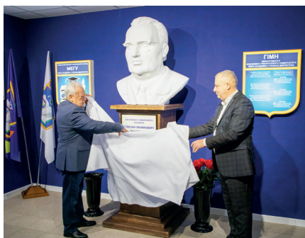
Урочисте відкриття погруддя засновнику ПВНЗ МЕГУ – Степану Дем'янчуку

Рік, присвячений 100-річчю академіка Степана Дем'янчука, у Міжнародному економіко-гуманітарному університеті імені академіка Степана Дем'янчука став знаковою подією для всієї академічної спільноти. Університет традиційно з великою повагою ставиться до власних історичних постатей і зберігає наукові та гуманістичні ідеї свого засновника, тому ювілей відзначався на високому організаційному та змістовному рівні. Для студентів, викладачів і випускників цей рік став періодом осмислення спадщини науковця, його ідей та принципів, на яких і сьогодні тримається університетське життя.