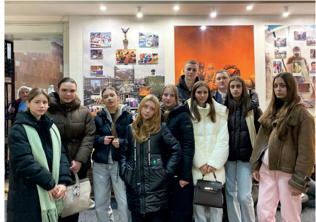
Студенти факультету географії, історії та туризму на екскурсії «Творці історії» організовану Рівненським обласним краєзнавчим музеєм

Особливістю навчання на освітніх програмах факультету географії, історії та туризму є щомісячне прове-