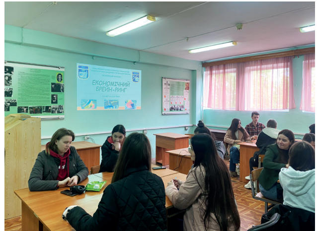
Щорічний економічний брейн-ринг