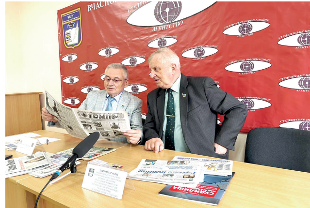
Прес конференція з Дмитром Тарасюком, головою Рівненської обласної організації Національної спілки журналістів України

Факультет готує фахівців для медіа, інформантств, пресслужб установ та організацій, рекламних агентств, команд, які спеціалізуються на зв'язках з громадськістю, культурних осередків. Підготовка спеціалістів здійснюється за денною та заочною формами. Навчання максимально пристосоване до потреб сучасних українських медіа. Студенти, починаючи з