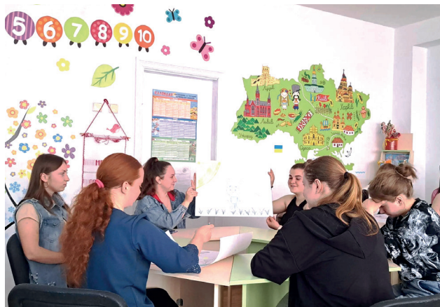
Проектна робота студентів педагогічного факультету