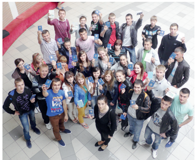
Урочне вручення дипломів студентам факультету європейської освіти МEGУ

У студентів є прекрасна можливість проходження практики та семестрового навчання завдяки програмі мобільності студентів – Erasmus+, яка фінансується Європейським Союзом. Переважно бази практик – це готелі на найкращих курортах Туреччини, Італії, Іспанії, Болгарії та ін. Програма Erasmus+ передбачає чотиримісячне стажування студентів із виплатою їм стипендії у розмірі 350-500 євро в місяць. Крім того, студент під час проходження практики перебуває на повному забезпеченні роботодавця (харчування, проживання тощо). Під час практики студент здобуває практичні навички свого фаху з використанням кращих новітніх європейських технологій. І, звичайно ж, активна мовна практика – це теж грандіозний здобуток. Кожна молода людина відкриває для себе культурний європейський простір, що надзвичайно позитивно впливає на формування новітньої ментальності. Приємно, що багато випускників Міжнародного економіко-гуманітарного університету імені академіка Степана Дем'янчука, які навчалися паралельно в МEGУ і за кордоном, нині працюють в українських та зарубіжних компаніях, ЗМІ. Саме та обставина, що вони впродовж навчання змогли освоїти європейські стандарти бізнесу, допомагає їм ефективно адаптуватися до ринкових українських та міжнародних реалій.