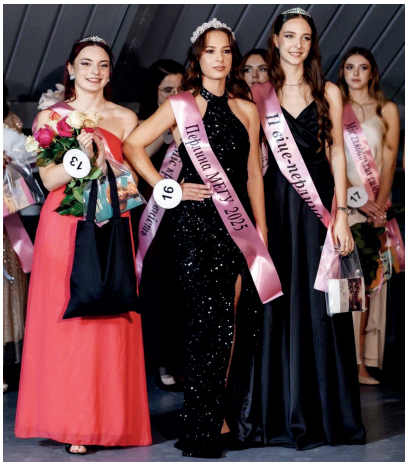
Переможці конкурсу Перлина МЕГУ 2025

Якщо ви креативні, мрієте досягти вершин не тільки в навчанні, а й в мистецтві – вас очікують в Центрі естетичного та громадянського виховання студентської молоді Міжнародного економіко-гуманітарного університету імені академіка Степана Дем'янчука.