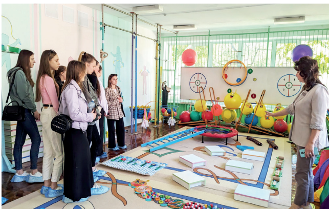
Лабораторне заняття зі здобувачами вищої освіти спеціальності Дошкільна освіта в ЗДО № 40